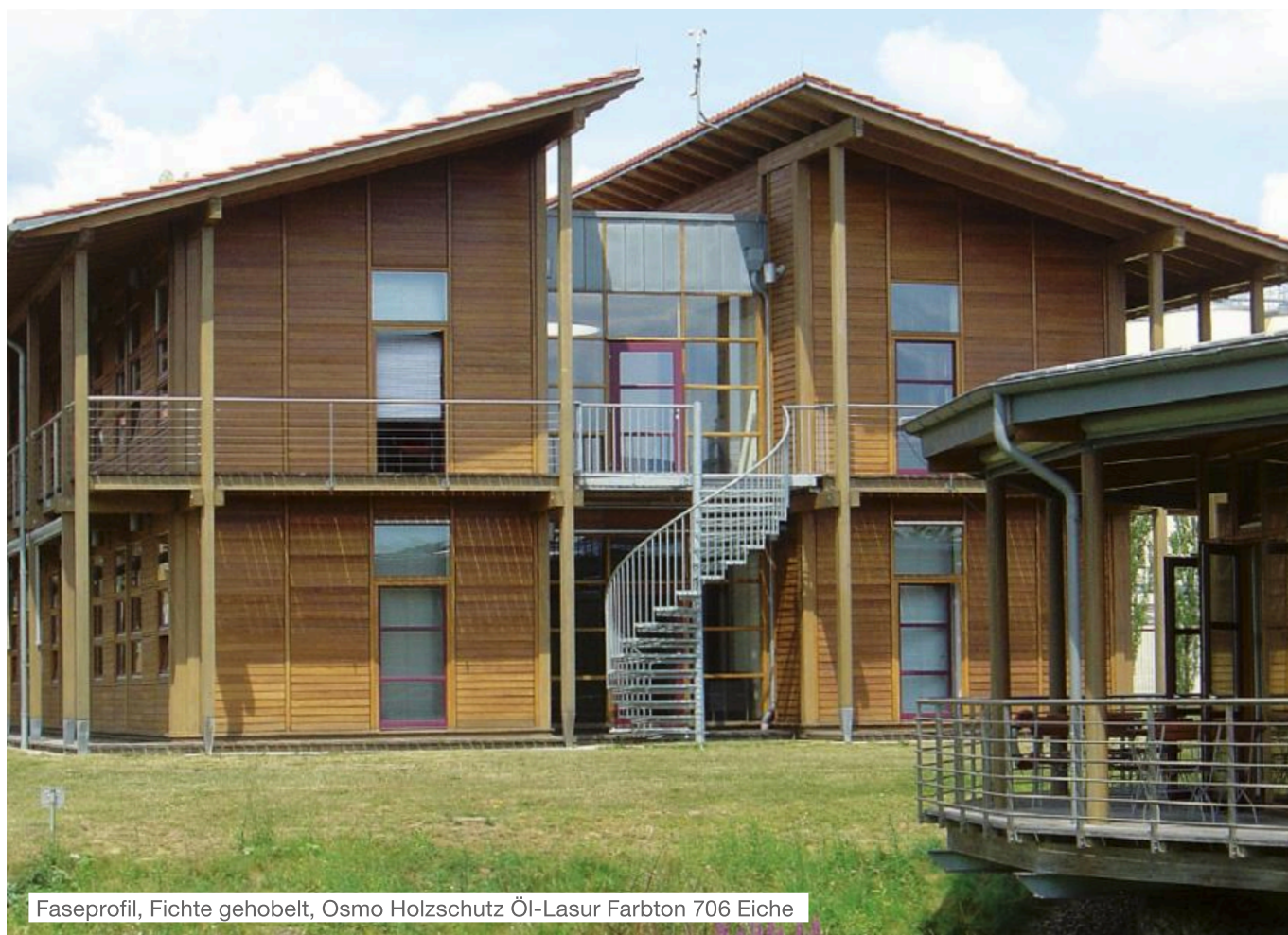
Faseprofil, Fichte gehobelt, Osmo Holzschutz Öl-Lasur Farbton 706 Eiche